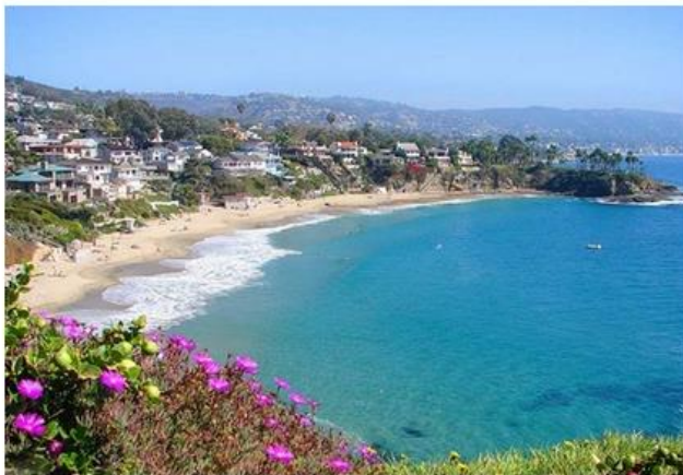
Coastline in Orange County