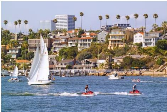
Orange County, California is keen to attract more tourists from the Gulf region.

The president of a tourism association in California has backed Gulf carriers in the ongoing dispute with US rivals over alleged subsidies and violations of the Open Skies pact.